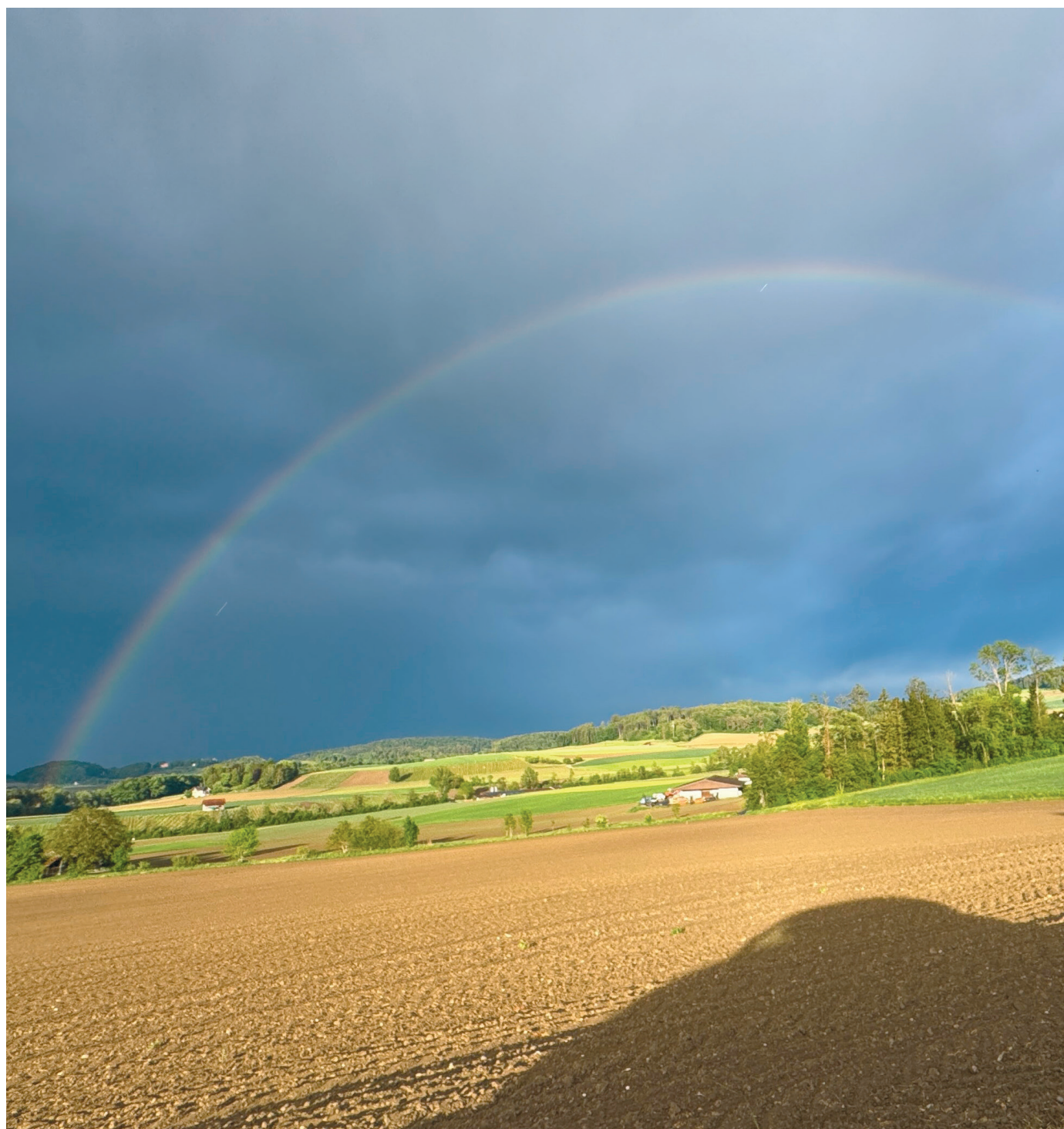
Der lang ersehnte Regen über Buch.