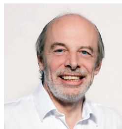
10. Juni, 19.30 Uhr Martin Kaiser Pfarrhaus Buch am Irchel